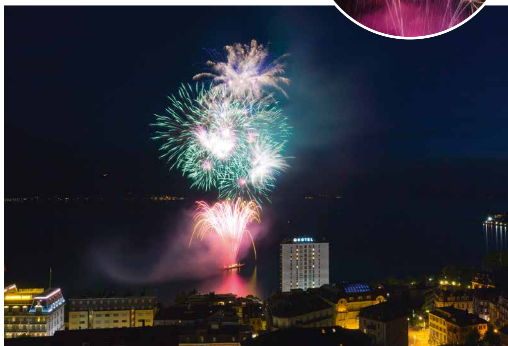
Les feux d'artifice sur le lac

La Vieille Ville de Montreux propose de célébrer la fête nationale en musique et en lumière, sur