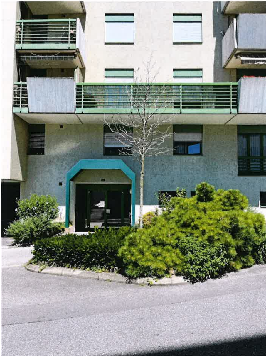
Parcelle DP 326, Rue des Vaudrès, Liquidambar styraciflua